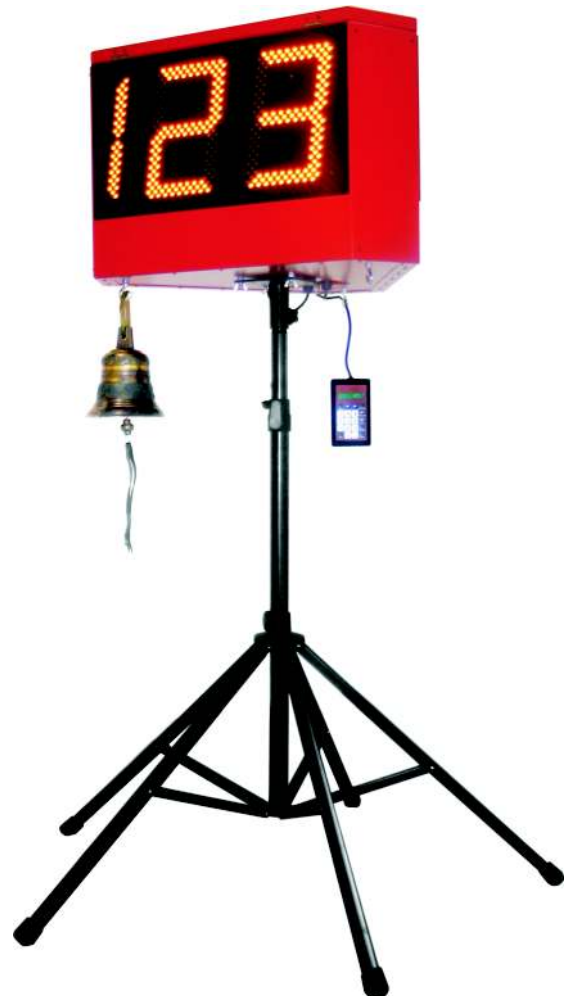
Le LAP COUNTER avec son contrôleur et support. Cloche en option.

Le LAP COUNTER est fourni sur un support tubulaire à 5 pieds, réglable en hauteur et assurant une bonne stabilité. Il est équipé de 3 crochets permettant de fixer la cloche optionnelle de "Dernier Tour", et spécialement gravée avec le logo SWISSTIMING.